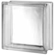
CLEAR 883 CLARITY* CODE: 8832