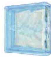
AZUR LINEAR END 1919/8 WAVE CODE: UCZ801