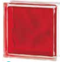
BRILLY RED 1919/8 WAVE CODE: C40013