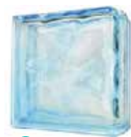
AZUR DOUBLE END 1919/8 WAVE CODE: UCZ901