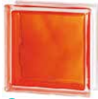
BRILLY ORANGE 1919/8 WAVE CODE: C40012