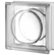
CLEAR 883 ALPHA CODE: 8846