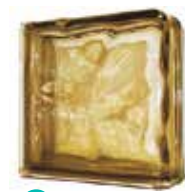
BROWN DOUBLE END 1919/8 WAVE CODE: UCZ904