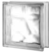
CLEAR 883 NUBIO CODE: 8834