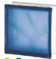
BLUE 1919/8 WAVE SAHARA 2S* CODE: 1606