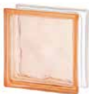
PINK 1919/8 WAVE CODE: 1502