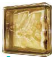
BROWN LINEAR END 1919/8 WAVE CODE: UCZ804