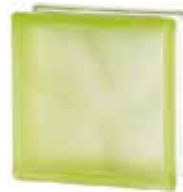
GREEN 1919/8 WAVE SAHARA 2S* CODE: 1603