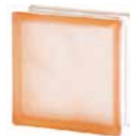
PINK 1919/8 WAVE SAHARA 2S* CODE: 1602