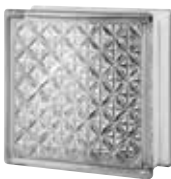
CLEAR 883 AKTIS CODE: 8842