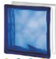
BLUE 1919/8 WAVE CODE: 1506