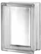
CLEAR 683 CLARITY* CODE: 6832