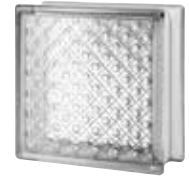
CLEAR 883 DM CODE: 8838