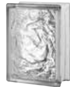
CLEAR 683 ICY CODE: 6838