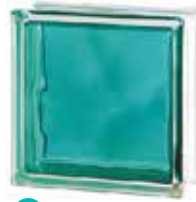
BRILLY TURQUOISE 1919/8 WAVE CODE: C40017