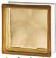
BROWN 1919/8 WAVE CODE: 1504