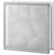
CLEAR 883 NUBIO SAHARA 2S CODE: 8836