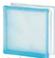
AZUR 1919/8 WAVE SAHARA 2S* CODE: 1601