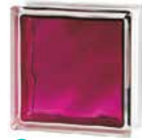
BRILLY RUBY 1919/8 WAVE CODE: C40014