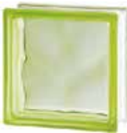
GREEN 1919/8 WAVE CODE: 1503