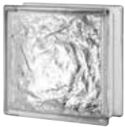
CLEAR 883 ICY CODE: 8840