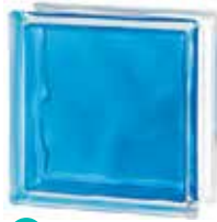
BRILLY BLUE 1919/8 WAVE CODE: C40016