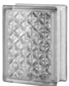
CLEAR 683 AKTIS CODE: 6840