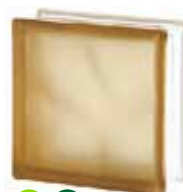
BROWN 1919/8 WAVE SAHARA 2S* CODE: 1604