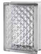
CLEAR 683 DM CODE: 6836