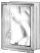
CLEAR 683 NUBIO CODE: 6834