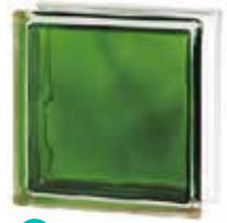
BRILLY EMERALD 1919/8 WAVE CODE: C40018