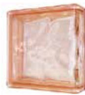
PINK LINEAR END 1919/8 WAVE CODE: UCZ802

*Sahara 1 side (sandblasted) available on demand; minimum order 360 pcs. / Sahara 1 face (sablée) disponible sur demande; commande minimum 360 pièces. / Sahara 1 Seite (sandgestrahlt) auf Anfrage erhältlich; Mindestbestellmenge 360 Stk. / Sahara 1 lado (satinado a la arena) disponible bajo pedido; pedido mínimo de 360 piezas.