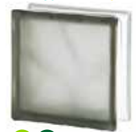
GREY 1919/8 WAVE SAHARA 2S* CODE: 1605