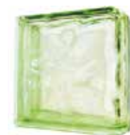
GREEN DOUBLE END 1919/8 WAVE CODE: UCZ903