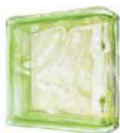
GREEN LINEAR END 1919/8 WAVE CODE: UCZ803