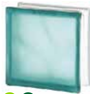
TURQUOISE 1919/8 WAVE SAHARA 2S* CODE: 1607