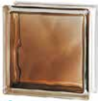
BRILLY BRONZE 1919/8 WAVE CODE: C40019