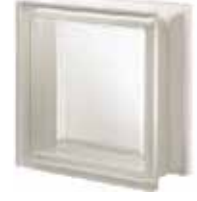
NEUTRO Q19 T SAHARA 1S CODE: S8011