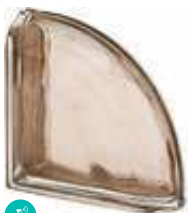
TORTORA TER CURVO O MET CODE: S9003