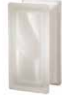
NEUTRO R09 O SAHARA 2S CODE: 8003