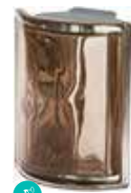
TORTORA ANG O MET CODE: S1003

Please note that glass blocks in the New Colour Collection may change their shades due to the HAND MADE processing of the colour. The New Colour Collection is sensitive to UV and therefore suggested for interior applications. Store in temperatures higher than 0°C/32°F. / Veuillez noter que les produits de la New Colour Collection pourraient subir des variations dans les tonalités des couleurs dues au processus manuel de leur réalisation. Les produits de la New Colour Collection, sensibles aux rayons UV, sont conseillés pour des applications intérieure. On recommande le stockage à des températures supérieures à 0°C /32°F. / Hinweis: Die Farbtöne der Produkte der New Colour Collection könnten aufgrund der HAND MADE-Verarbeitung unterschiedlich ausfallen. Die Produkte der New Colour Collection, wegen ihrer Empfindlichkeit gegen UV-Strahlung, werden für Anwendungen im Innenbereich empfohlen. Sie sollten bei Temperaturen über 0° C /32°F gelagert werden. / Se recuerda que los productos de la Colección New Colour pueden sufrir variaciones en la tonalidad de los colores debidas a la elaboración hecha a mano. Los productos de la New Colour Collection ya que resultan sensibles a los rayos UV están aconsejados para aplicaciones en interiores. Se recomienda almacenarlos a temperatura superior a los 0°C/32° F.