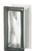
NORDICA R09 O SAT 1 LATO CODE: S900505