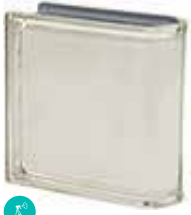
BIANCO TER LINEARE O MET CODE: S7002