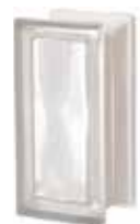
NEUTRO R09 O SAHARA 1S CODE: S8003