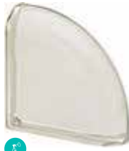
BIANCO TER CURVO O MET CODE: S9002