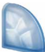
BLU TER CURVO O SAHARA 2S CODE: S30302