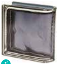
ARDESIA TER LINEARE O MET CODE: S7001