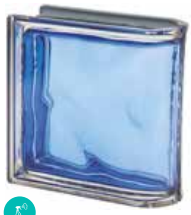
COBALTO TER LINEARE O MET CODE: S7005