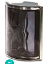
ARDESIA ANG O MET CODE: S1001