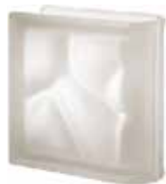
NEUTRO TER LINEARE O SAT CODE: S202