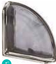
ARDESIA TER CURVO O MET CODE: S9001