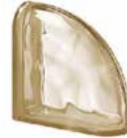
SIENA TER CURVO O CODE: S30105