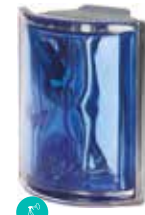
COBALTO ANG O MET CODE: S1005