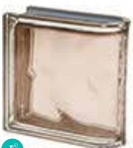
TORTORA TER LINEARE O MET CODE: S7003