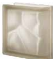
SIENA TER LINEARE O SAHARA 2S CODE: S20205