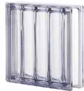
NEUTRO Q30 DORIC CODE: D01001