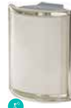
BIANCO ANG O MET CODE: S1002