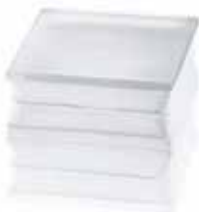
BG 1919/16 60F CLEARVIEW SAHARA 2S* CODE: T077