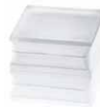
BG 1919/16 90F CLEARVIEW SAHARA 2S* CODE: T079