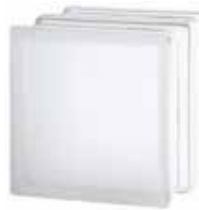
1919/16 90F CLEARVIEW SAHARA 2S* CODE: T021