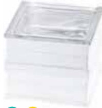
BG 1919/16 90F CLEARVIEW CODE: T078