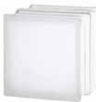
1919/16 60F CLEARVIEW SAHARA 2S* CODE: T019