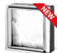
1919/13 120F NUBIO CODE: T029

* Sahara 1 side (sandblasted) available on demand. / Sahara 1 face (sablée) disponible sur demande. / Sahara 1 Seite (sandgestrahlt) auf Anfrage erhältlich. / Sahara 1 lado (satinado a la arena) disponible bajo pedido.