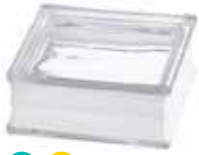
BG 1919/8 30F CLEARVIEW CODE: T074