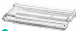
MARSEILLE TILE CODE: T7034

* Sahara 1 side (sandblasted) available on demand. / Sahara 1 face (sablée) disponible sur demande. / Sahara 1 Seite (sandgestrahlt) auf Anfrage erhältlich. / Sahara 1 lado (satinado a la arena) disponible bajo pedido.