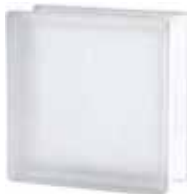
1919/8 BSH20 WAVE SAHARA 2S* CODE: T006