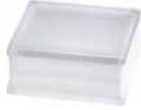
BG 1919/8 30F CLEARVIEW SAHARA 2S* CODE: T075