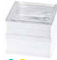
BG 1919/16 60F CLEARVIEW CODE: T076