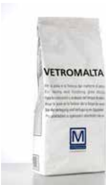
Glass mortar "Vetromalta" White or grey premixed mortar / Vetromalta Il s'agit d'un liant prémélangé de couleur blanche ou grise / Vetromalta Vorgemischter Mörtel in den Farben Weiß oder Grau / Vetromalta Es un mortero premezclado de color blanco o gris