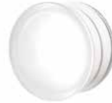
BG R19/10 CLEARVIEW SAHARA 1S CODE: C01002