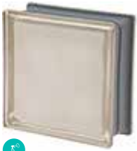
BIANCO Q19 O MET CODE: C4003