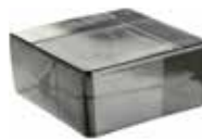
NORDICA VETROPIENO QUADRATO CODE: TP10304