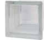
CLEAR 664 CLARITY* CODE: 66451