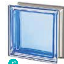
ZAFFIRO Q19 T MET CODE: 2022

Please note that glass blocks in the Mendini Collection may change their shades due to the HAND MADE processing of the colour. The Mendini Collection is sensitive to UV and therefore suggested for interior applications. Store in temperatures higher than 0°C/32°F. / Veuillez noter que les produits de la Mendini Collection pourraient subir des variations dans les tonalités des couleurs dues au processus manuel de leur réalisation. Les produits de la Mendini Collection, sensibles aux rayons UV, sont conseillés pour des applications intérieure. On recommande le stockage à des températures supérieures à 0°C /32°F. / Hinweis: Die Farbtöne der Produkte der Mendini Collection könnten aufgrund der HAND MADE-Verarbeitung unterschiedlich ausfallen. Die Produkte der Mendini Collection, wegen ihrer Empfindlichkeit gegen UV-Strahlung, werden für Anwendungen im Innenbereich empfohlen. Sie sollten bei Temperaturen über 0° C /32°F gelagert werden. / Se recuerda que los productos de la Colección Mendini pueden sufrir variaciones en la tonalidad de los colores debidas a la elaboración hecha a mano. Los productos de la Mendini Collection ya que resultan sensibles a los rayos UV están aconsejados para aplicaciones en interiores. Se recomienda almacenarlos a temperatura superior a los 0°C/32° F.