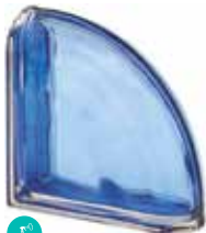
COBALTO TER CURVO 0 MET CODE: S9005