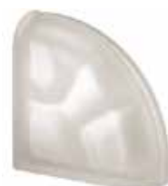
NEUTRO TER CURVO O SAT CODE: S303