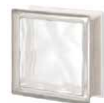
NEUTRO Q19 O SAHARA 1S CODE: S8010