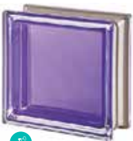
AMETISTA Q19 T MET CODE: 2013