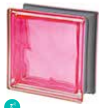
MAGENTA Q19 O MET CODE: C4006