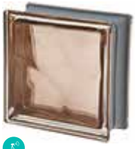
TORTORA Q19 O MET CODE: C4016