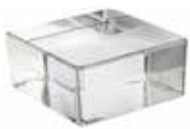
NEUTRO VETROPIENO QUADRATO CODE: TP10301