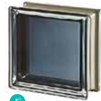
BLACK 30% Q19 T MET CODE: 1083