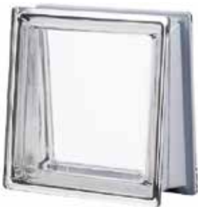
NEUTRO Q30 TRAPEZOIDAL T MET CODE: TR1004