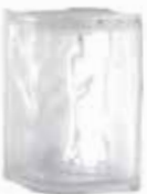
CLEAR 484 NUBIO CORNER 90° CODE: 48434