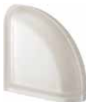
NEUTRO TER CURVO T SAT CODE: S304