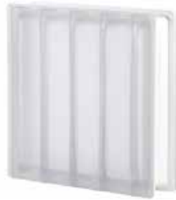
NEUTRO Q30 DORIC SAHARA 2S CODE: D01002