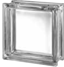
CLEAR 1919/8 CLEARVIEW CRAFTBLOCK CODE: A108