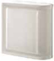
NEUTRO TER LINEARE T SAHARA 2S CODE: S203