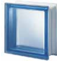
BLU Q19 T SAHARA 1S CODE: S00202