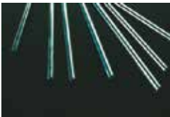
AISI 430 Stainless Steel Rods Barres en acier inoxydable AISI 430 Rundstahl Edelstahl AISI 430 Varillas de acero inoxidable AISI 430