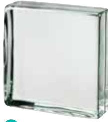
CLEAR 883 VISTABRIK* CODE: T8830