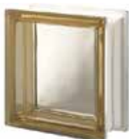
SIENA Q19 T CODE: 207