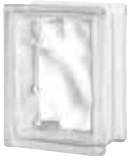
CLEAR 684 NUBIO CODE: 68430