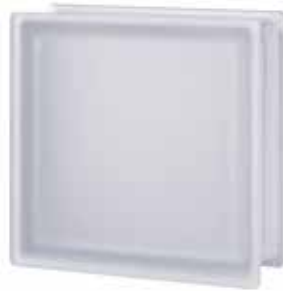
NEUTRO Q33 T SAHARA 2S* CODE: G11003