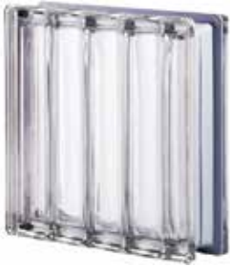
NEUTRO Q30 DORIC MET CODE: D01003