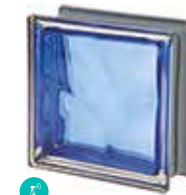
COBALTO Q19 O MET CODE: C4005