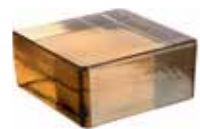
SIENA VETROPIENO QUADRATO CODE: TP10303