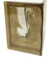
SIENA Q19 O CORNER 90° CODE: S11005