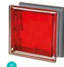
SCARLATTO Q19 O MET CODE: C4015