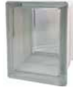
CLEAR 684 CLARITY* CODE: 68450