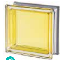
CITRINO Q19 T MET CODE: 2015