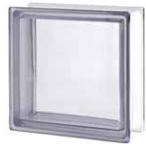
NEUTRO Q33 T CODE: G11002