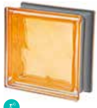
OCRA Q19 O MET CODE: C4013