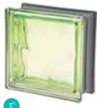
MUSCHIO Q19 O MET CODE: C4010