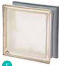
AVORIO Q19 O MET CODE: C4002