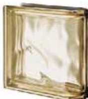
SIENA TER LINEARE O MET CODE: S80807