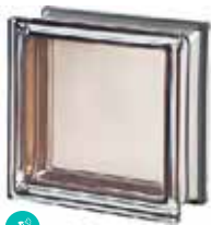
AGATA Q19 T MET CODE: 2012