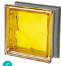
ORO Q19 O MET CODE: C4014