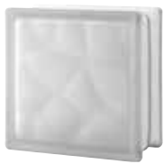
CLEAR 884 NUBIO SAHARA 2S* CODE: 884249