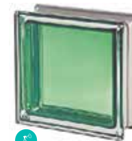
GIADA Q19 T MET CODE: 2017