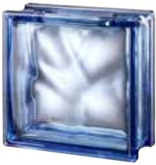
BLUE 1919/8 WAVE CRAFTBLOCK CODE: A110