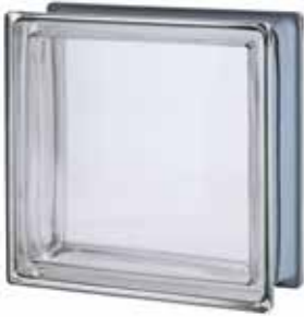
NEUTRO Q33 T MET CODE: G11005

Availability to be verified before the order. / Vérifiez la disponibilité avant de confirmer la commande. / Verfügbarkeit ist vor Bestellung zur prüfen. / Verificar la disponibilidad antes de confirmar el pedido.