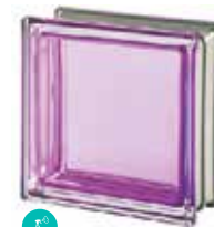
TORMALINA Q19 T MET CODE: 2021