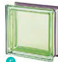
MALACHITE Q19 T MET CODE: 2018