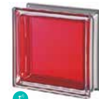
RUBINO Q19 T MET CODE: 2019