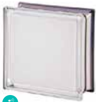
WHITE 100% Q19 T MET CODE: 1050