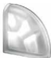
NORDICA TER CURVO O SAHARA 2S CODE: S30306