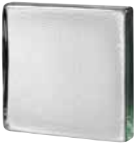
CLEAR 881.5 VISTABRIK STIPPLED* CODE: T8817