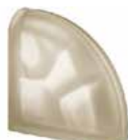
SIENA TER CURVO O SAHARA 2S CODE: S30305