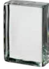
CLEAR 683 VISTABRIK CODE: T6830