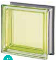
BERILLO Q19 T MET CODE: 2014