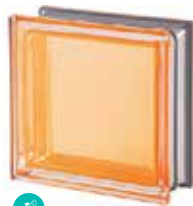
AMBRA Q19 T MET CODE: 2011