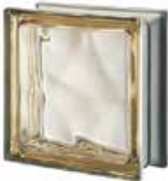
SIENA Q19 O MET CODE: 9107