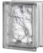
CLEAR 684 CORTINA CODE: 68440