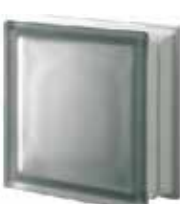
NORDICA Q19 T SAHARA 2S CODE: 405