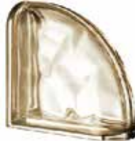
SIENA TER CURVO O MET CODE: S90907