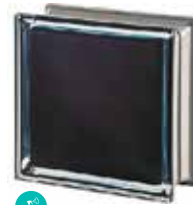
BLACK 100% Q19 T MET CODE: 1080