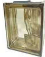
SIENA Q19 O MET CORNER 90 CODE: S99507