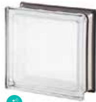
WHITE 30% Q19 T MET CODE: 1053