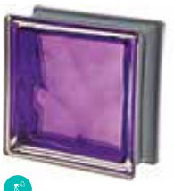
INDACO Q19 O MET CODE: C4008