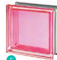
CORALLO Q19 T MET CODE: 2016