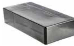
NORDICA VETROPIENO RETTANGOLARE CODE: T10204