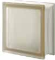
SIENA Q19 T SAHARA 2S CODE: 407