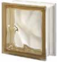
SIENA Q19 O CODE: 107