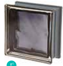
ARDESIA Q19 O MET CODE: C4001