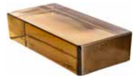
SIENA VETROPIENO RETTANGOLARE CODE: T10203