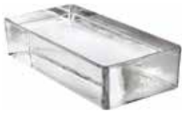
NEUTRO VETROPIENO RETTANGOLARE CODE: T101