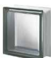
NORDICA Q19 T SAHARA 1S CODE: S00205