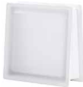
NEUTRO Q30 TRAPEZOIDAL T SAHARA 2S* CODE: TR1002