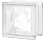
CLEAR 664 NUBIO CODE: 66431