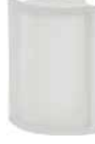
NEUTRO ANG T SAT CODE: S103