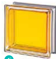
TOPAZIO Q19 T MET CODE: 2020