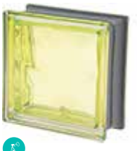
KIWI Q19 O MET CODE: C4009