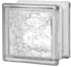
CLEAR 664 CORTINA* CODE: 66441