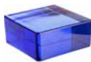
BLU VETROPIENO QUADRATO CODE: TP10302