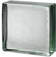
CLEAR 883 VISTABRIK STIPPLED CODE: T8837

*Verify the availability. / Vérifiez la disponibilité. / Verfügbarkeit und minimale Produktionsmenge. / Verificar la disponibilidad.