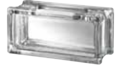
CLEAR 483 CLARITY CRAFTBLOCK CODE: A111