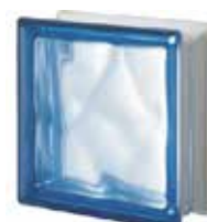
BLU Q19 O SAHARA 1S CODE: S00102