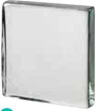
CLEAR 881.5 VISTABRIK* CODE: T8815