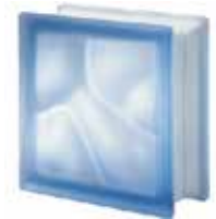
BLU Q19 O SAHARA 2S CODE: 302