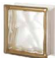
SIENA Q19 O SAT 1 LATO CODE: S00107