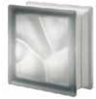
NORDICA Q19 O SAT CODE: 305