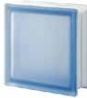
BLU Q19 T SAHARA 2S CODE: 402