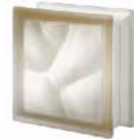
SIENA Q19 O SAHARA 2S CODE: 307