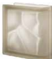
SIENA TER LINEARE O SAHARA 2S CODE: S20205