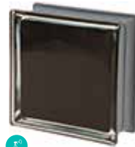
NERO Q19 O MET CODE: C4012