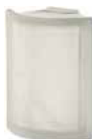
NEUTRO ANG O SAT CODE: S102