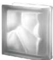
NORDICA TER LINEARE O SAT CODE: S20206