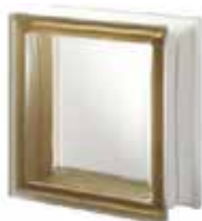
SIENA Q19 T SAHARA 1S CODE: S00207

* Sahara (sandblasted) available on demand / Sahara (sablée) disponible sur demande / Sahara (sandgestrahlt) auf Anfrage erhältlich / Sahara (satinado a la arena) disponible bajo pedido.