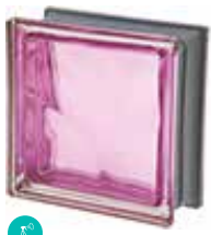
MALVA Q19 O MET CODE: C4011