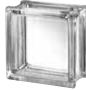
CLEAR 663 CLARITY CRAFTBLOCK CODE: A106