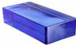
BLU VETROPIENO RETTANGOLARE CODE: T10202