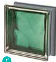
SMERALDO Q19 O MET CODE: C4007