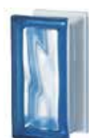
BLU R09 O SAHARA 1S CODE: S900502