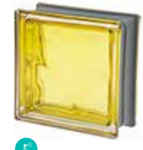
CEDRO Q19 O MET CODE: C4004