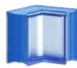
MG/s MINI BLUEBERRY CORNER 14,6x14,5x8 CM Mi8704CO